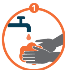
Se laver les mains