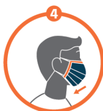
Abaissier le bas du masque sous le menton