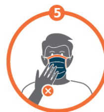
Une fois ajusté, ne plus toucher le masque avec les mains