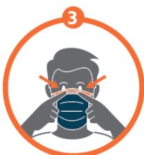
Pincer la barrette nasale avec les deux mains pour l'ajuster au niveau du nez