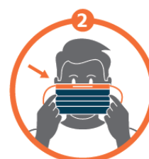
Placer le masque sur le visage, le bord rigide vers le haut et l'attacher